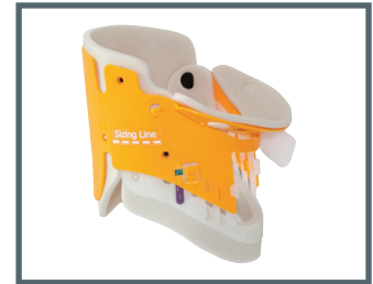
Ambu Redi-ACE Mini