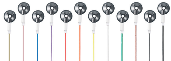
12 verschiedene Kabelfarben