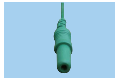
M = 1.5 mm Konnektor