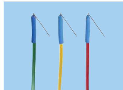
Subdermal Hooked Nadelelektrode