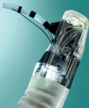
Darstellung des Albarran-Hebels mit der Verwendung eines Sphinkterotoms

Ambu bietet Ihnen mit dem neuen Ambu aScope Duodeno ein Endoskop mit gleichbleibender Leistung, wodurch das Risiko einer Kreuzkontamination des Patienten vermieden wird. Darüber hinaus besteht keine Notwendigkeit einer kostspieligen Aufbereitung oder Reparatur.