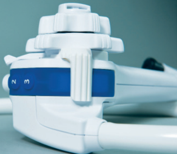
Die Albarran-Hebel-Steuerung bewegt den Albarran-Hebel auf- und abwärts..