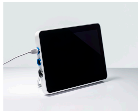
Ambu aView 2 Advance