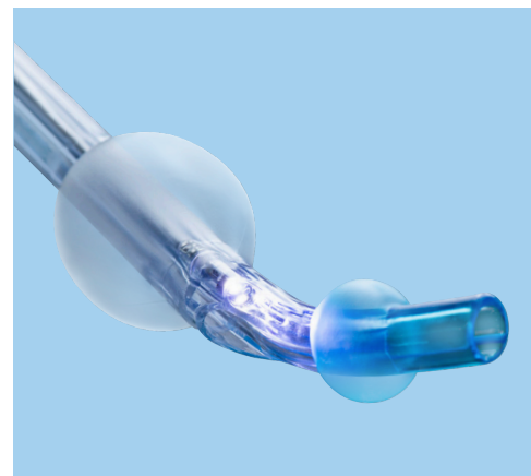
Ambu VivaSight 2 DLT