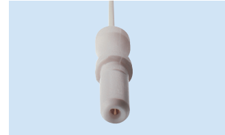
K = 1.5 mm Anschluss