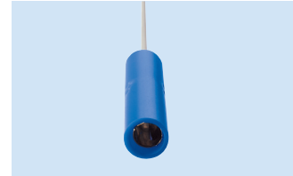
A = 4 mm Anschluss