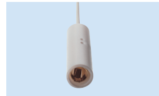
F = 3 mm Anschluss