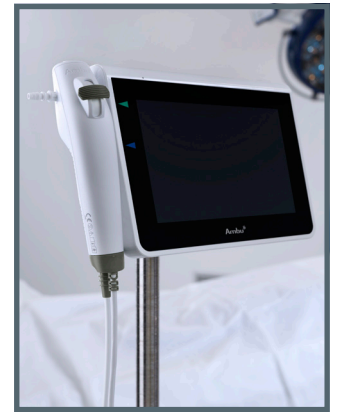
Ambu® aScope™ 4 Broncho Slim und Ambu® aView™