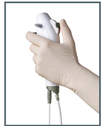
Das ergonomische und leichte Handstück bietet optimalen Halt und Griffkomfort