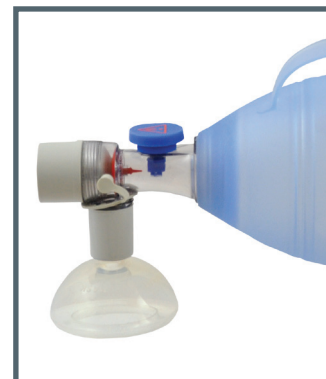
Ambu Oval Plus Kinder mit Open-Cuff-Maske

Die Ambu Oval Plus Silikon-Beatmungsbeutel können komplett bei 134°C autoklaviert werden. Die Beutel bestehen aus Silikon und beinhalten kein Latex.