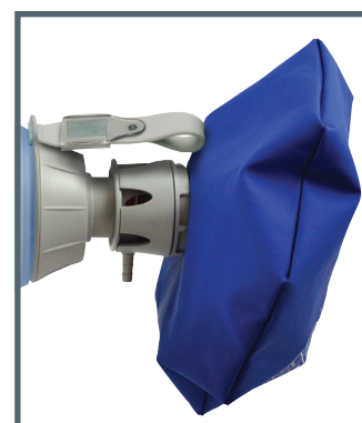
Einlassventil mit Sauerstoffreservoirbeutel