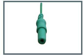
M = 1,5 mm Anschluss